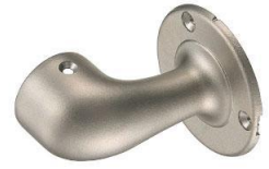
ショットプラスト